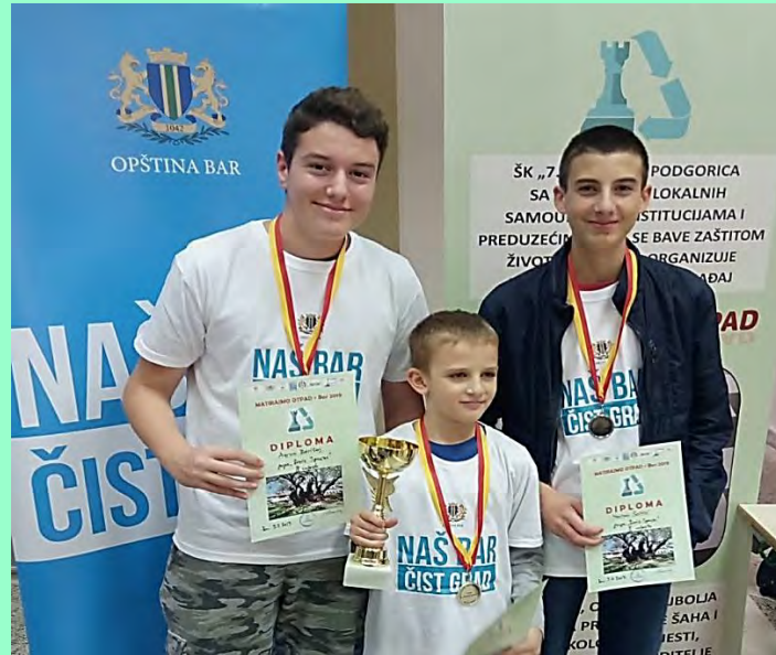
Grupa „Boris Spaski“