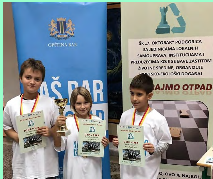
Grupa „Anatolij Karpov”