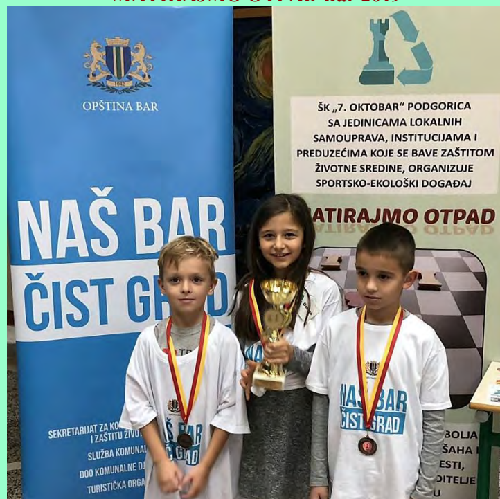
grupa „Gari Kasparov”